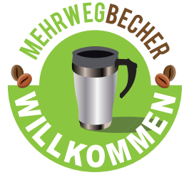
Kampagnenaufkleber für gastronomische Einrichtungen

Sie wollen Teil der Kampagne werden und Ihren Kunden schon am Eingang und im Dresdner Themenstadtplan zeigen, dass Umweltschutz bei Ihnen groß geschrieben wird? Dann fordern Sie über das Abfall-Info-Telefon (03 51) 4 88 96 33 oder per E-Mail an abfallberatung@dresden.de den Kampagnenaufkleber an und lassen Sie sich in den Themenstadtplan eintragen.