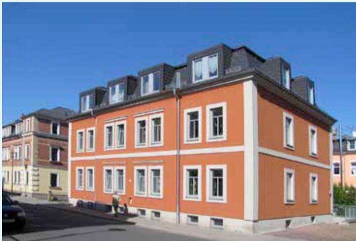
Ambulant Betreutes Wohnen, Freital

Seit 144 Jahren unterstützen wir Menschen in Dresden und den umliegenden Regionen, ihr Leben selbstbestimmt und in Gemeinschaft zu gestalten. In unserer täglichen Arbeit stärkt und begleitet uns unser Vertrauen zu Gott. Unser diakonischer Auftrag ist es, Menschen zu stärken, zu pflegen, zu trösten und zu beraten.