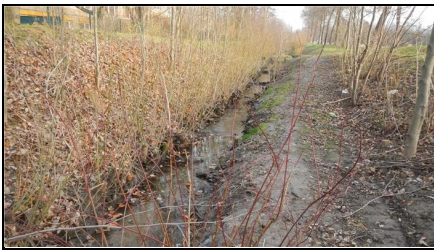
Abb. 4: Nach der Maßnahme: Einbau von Buhnen zur Strömungslenkung, 09.01.2018

Straße teilweise mit erheblichen Feinsedimentansammlungen mit hohem Anteil an organischem Feinmaterial (Schlamm etc.) in strömungsarmen Bereichen