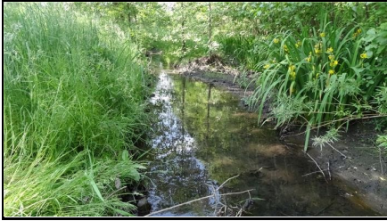
Abb. 2: Vor der Maßnahme: Verschlämmlung im renaturierten Abschnitt, 23.05.2017