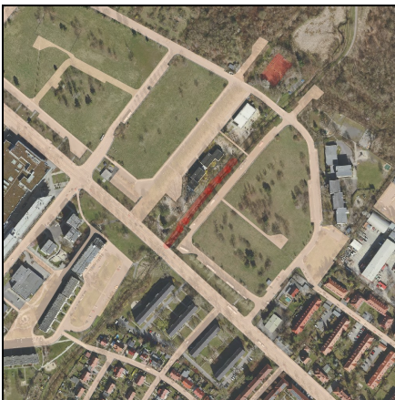
Lageplan Maßnahme, Maßstab 1:10000