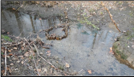
Abb. 3: Nach der Maßnahme: Freispülung des gewässertypischen Sohlmaterials, 09.01.2018