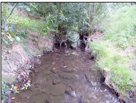
Abb. 1: Vor der Maßnahme: Zugesetztes Gewässerbett, 13.08.2015