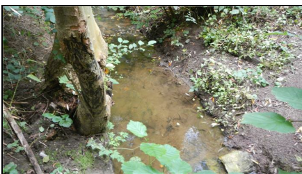
Abb. 1: Vor der Maßnahme: Ablagerungen von Feinsediment im Gewässerbett, 28.09.2017