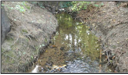
Abb. 2: Vor der Maßnahme: breiter Gewässerabschnitt mit fehlender Profilvarianz, 28.09.2017