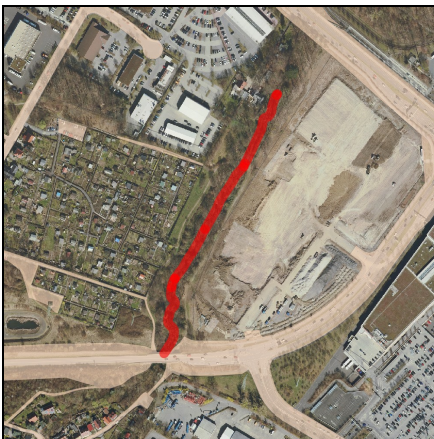
Lageplan Maßnahme, Maßstab 1:10.000