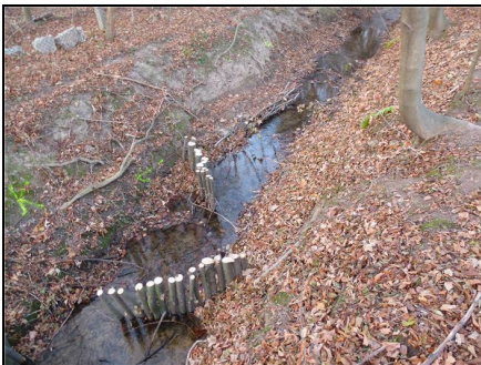
Abb. 4: Nach der Maßnahme: Rechenbühnen zur Initiierung von Profilvarianz, 16.12.2020