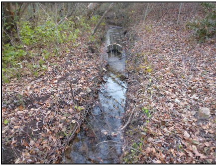
Abb. 3: Nach der Maßnahme: abschnittsweise Einengung des Gewässerquerschnitts durch Bühnen und hinterpflanzte Toffaschinen, 16.12.2020