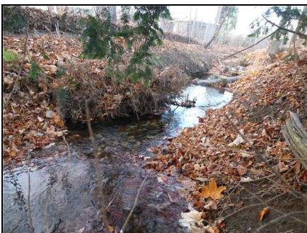
Abb. 5: Nach der Maßnahme: Fischunterstand aus Wurzelstubben mit Kiesbank, 16.12.2020