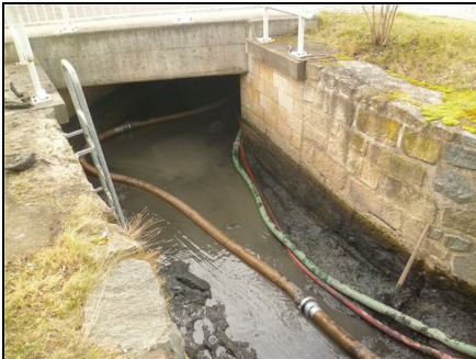
Abb. 4: Während der Maßnahme: Sedimentberäumung mittels Saugbagger, 30.01.2020