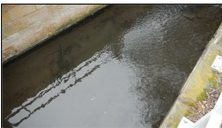
Abb. 1: Vor der Maßnahme: starke Schlammablagerungen an der Gewässersohle, 22.03.2018