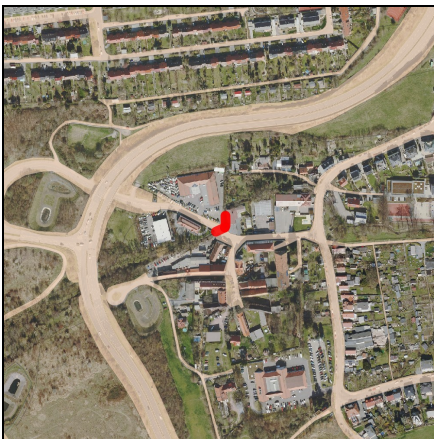
Lageplan Maßnahme, Maßstab 1:10.000