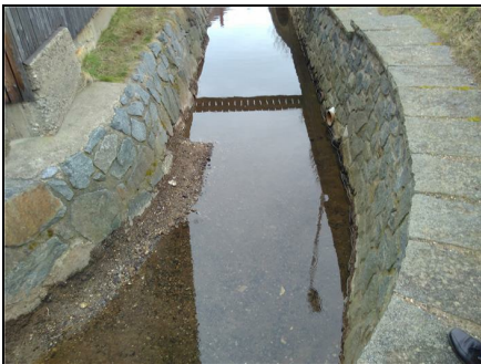
Abb. 5: Nach der Maßnahme: stromab des beräumten Gewässerabschnitts, 19.02.2020