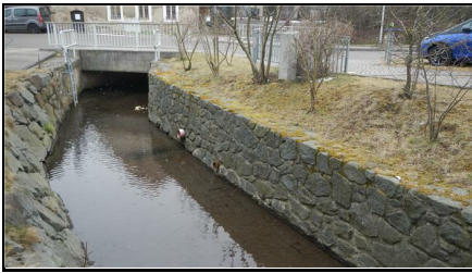
Abb. 3: Vor der Maßnahme: breites und flaches Gewässer mit Schlammablagerungen, 22.03.2018